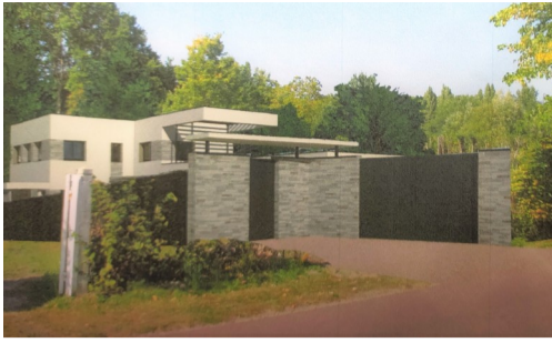
Photo du projet après travaux